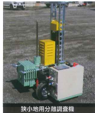
狭小地用分離調査機