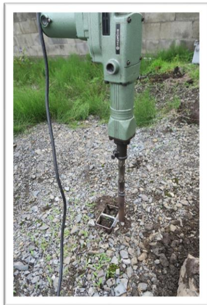
電動打撃式溝堀作業